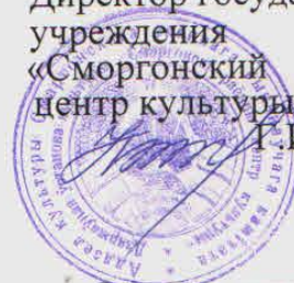
График выезда сектора нестационарного обслуживания и киновидеообслуживания населения на май 2026 года