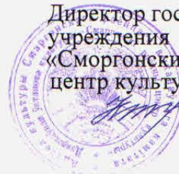
График выезда сектора нестационарного обслуживания и киновидеообслуживания населения на май 2026 года